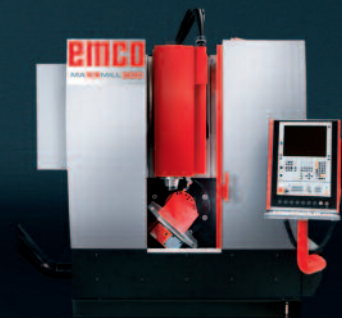
MAXMILL 500 Vertikales Fräszentrum für die 5-Seitenbearbeitung