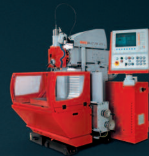
EMCOMAT FB 450-L Universal Werkzeugfräsmaschine mit EMCO-eigener Zyklussteuerung