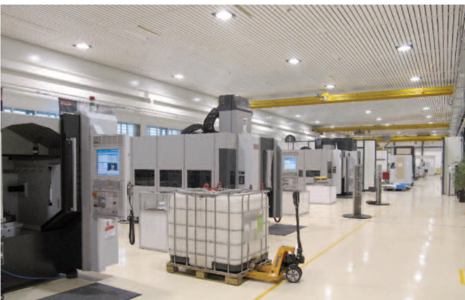
Halle et machines