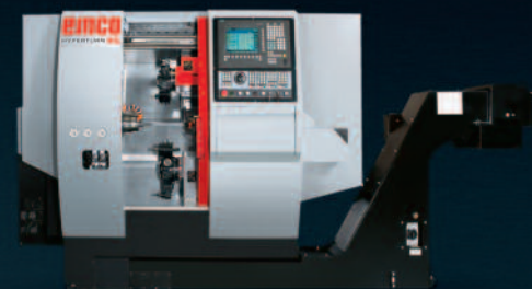
HYPERTURN 45 Hochleistungs-Drehzentrum für die Komplettbearbeitung