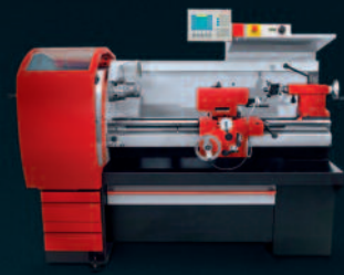
EMCOMAT 20 D Universal Drehmaschine für industrielle Anwendungen