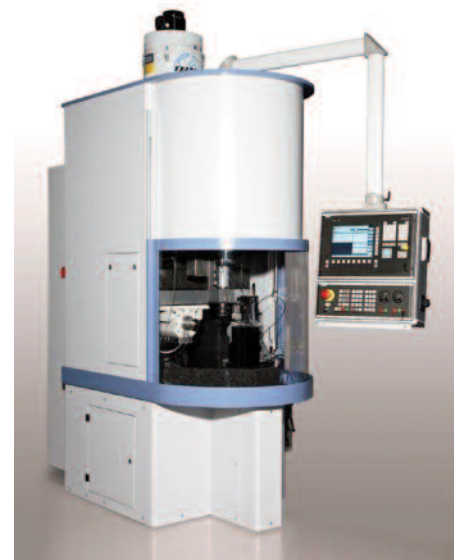
Machine spéciale de meulage CN

L'électroérosion reste l'activité principale de la société. Elle est utilisée pour la fabrication des outils (étampes) avec toutefois la particularité que ces outils ne sont pas conservés par Arcofil SA pour produire ensuite des pièces, mais ils sont vendus aux clients, contrairement à d'au-