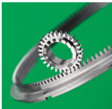
Micro-engrenages taillés par génération