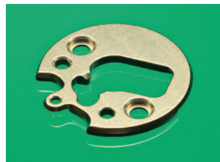
Composant horloger broché

Cela, sans oublier la confection de nouvelles pièces microtechniques stratégiques définissant les nouveaux produits. Par exemple dans l'horlogerie, soit pour le secteur mouvement, tel que la platine et ses ponts, les roues, les divers aciers et le rotor ou soit pour le secteur habillage, tel que le cercle de cage, la boîte, l'ébauche cadran, les appliques et sigles et autres aiguilles.