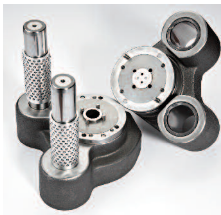
Etampe de découpage de denture

Faut-il proposer au client l'usinage de sa pièce, la réalisation de l'outil d'usinage voir d'une machine complexe? Telles sont les réponses que doit être capable d'apporter quotidiennement Arcofil SA aux industriels qui s'adressent