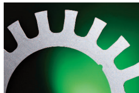
Exemple de découpage Laser