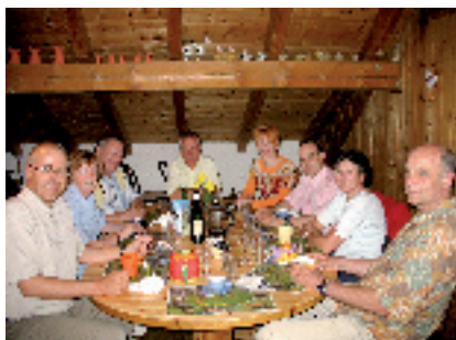
Ambiance conviviale lors d'une rencontre aux Croisettes