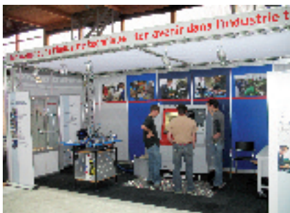
Stand du GIM-CH lors de l'exposition Planète Métier