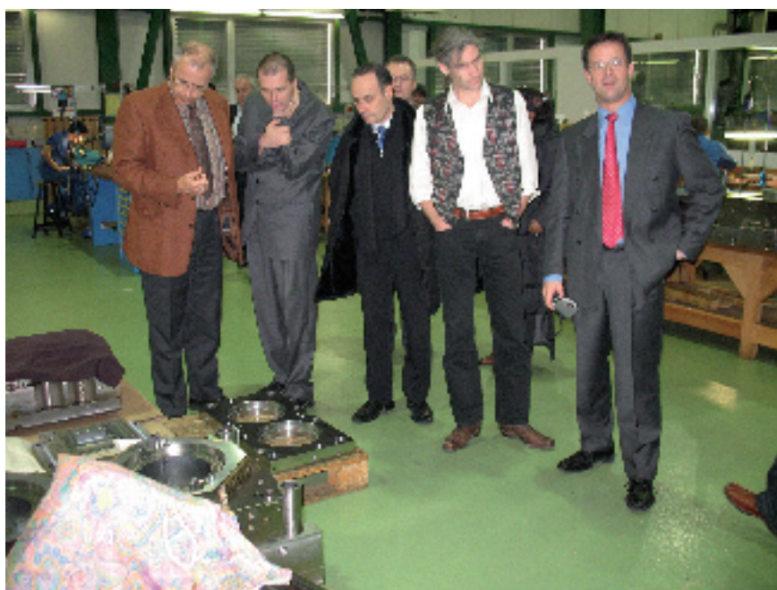
Le secrétaire à droite et quelques membres, admiratifs du travail réalisé

L'année écoulée fut pour le GIM-CH riche en évènements. Comme de coutume, nous ne retiendrons que quelques éléments significatifs.