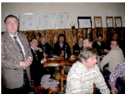
Partie récréative dans le carnotzet du Président de Swissmechanic