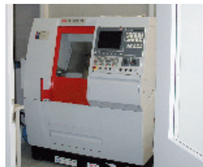
Le nouveau tour EMCO PC Turn du centre de formation du GIM-CH

Le centre de formation de l'Association, dont les locaux se trouvent à Lausanne, a accueilli en 2006 plus d'une centaine de jeunes en formation: apprentis polymécaniciens, constructeurs, électroniciens, storistes, ainsi que de nombreux jeunes accomplissant une année de scolarité supplémentaire. Le centre a acquis de nouvelles machines (fraiseuse et tour Schäublin ). Les activités du centre se développent de façon réjouissante et le centre a engagé un quatrième enseignant pour 2006 ainsi que quatre apprentis, un mécapraticien et trois polymécaniciens. Après deux ans de formation au centre, ils continueront leur formation en entreprise. Le centre de formation a été présenté dans le Burin soit le MSM 10/2006 .