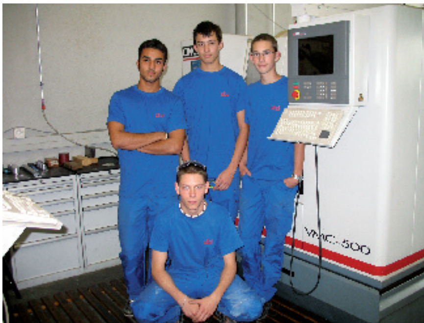
Les 4 apprentis du centre de formation

2007. Tenant compte des délais de résiliation avec les assureurs, ce résultat est encourageant.