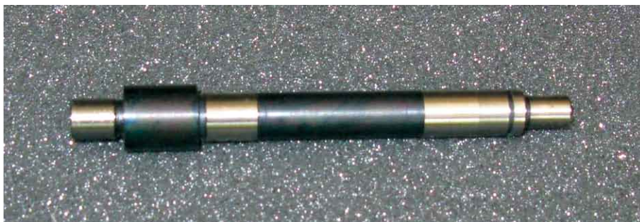
Axe de machine trempé-rectifié.

grande prudence par des investissements ciblés et échelonnés, de façon à garantir un complet autofinancement.