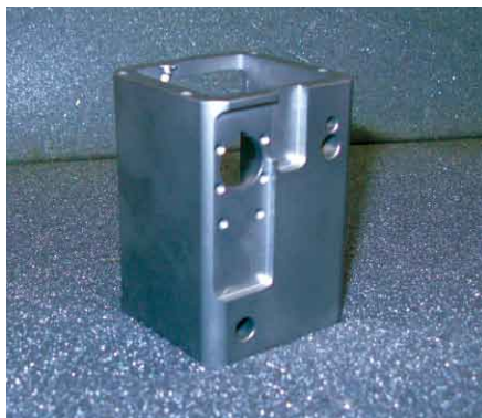
Prototype en inox microbille.