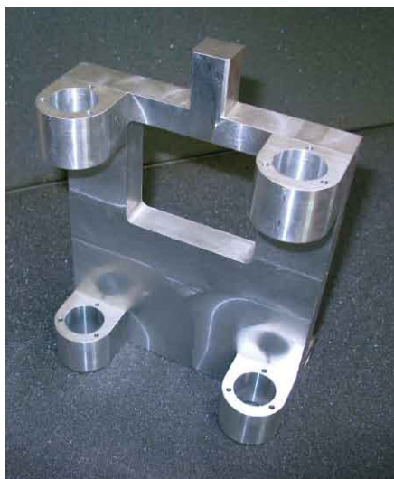
Pièces très élaborées de machine.