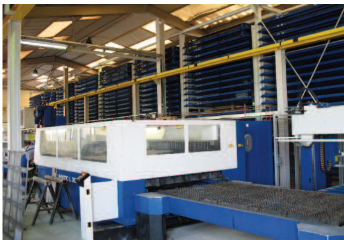
Machine à découper entièrement automatisé avec gestion des stock

Nous avons été approchés en 2008 avec d'autres associations partenaires pour rejoindre un projet Interreg qui a pour objectif de préparer en Suisse romande et en France voisine un vaste programme de formation modu-