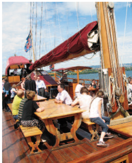
Les membres sur la Galère.

Le 19 juin 2008, les membres se sont réunis à bord de la Galère la Liberté sur les flots somptueux du Léman.