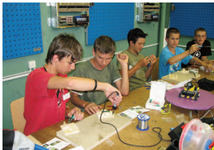
Stagiaires mecaforma en cours de robotique

conclu un accord de partenariat nous permettant en Suisse romande (sauf Fribourg) de dispenser les CIE du métier. Cette profession, très proche de l'industrie, se retrouve essentiellement dans la chimie et l'agroalimentaire. Elle se substituera peu à peu à l'automaticien souvent utilisé à mauvais escient comme responsable de la maintenance de lignes.