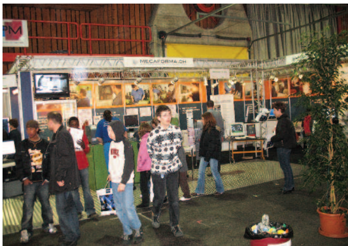
Stand Mecaforma à Martigny