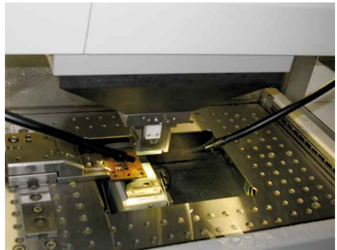
Machine à électro-érosion Progress V2.

de la société Agie, deux machines à électro-érosion Progress V2 de Agie, 1 machine à micro-érosion Compact CT1, 1 appareil de contrôle Vertex 120 d'une précision au micron, diverses presses jusqu'à 25 tonnes. Elle est dotée d'autre part de toutes les machines nécessaires à l'usinage et au montage des étampes qu'elle réalise. On constatera que l'électro-érosion tient une place importante dans le parc de machines de la société et ce qui est presque étonnant dans une entreprise dont tout l'historique a été lié à la fabrication d'étampes. Il s'agit d'une décision stratégique prise par la direction, en concertation entre Yves et Pierre Kaufmann, le premier étant passionné d'électro-érosion.