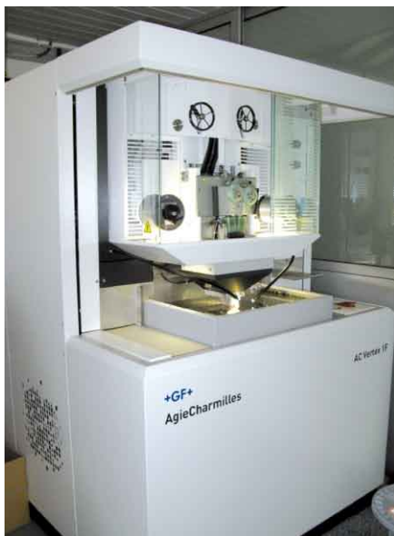
Machine à électro-érosion Vertex 1F de la société Agie.