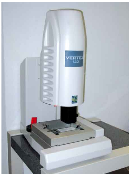
Appareil de contrôle Vertex 120.