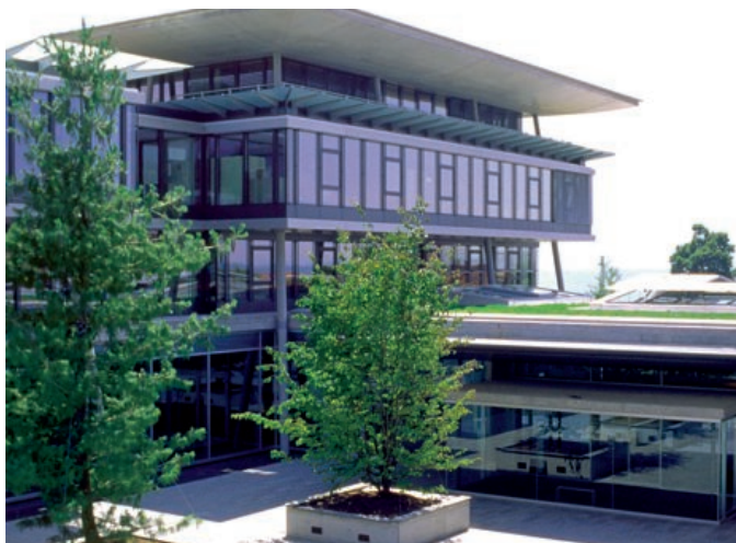
Le Centre patronal, à Paudex (près de Lausanne)

Le Groupement suisse de l'industrie mécanique fut un des premiers à sortir un guide