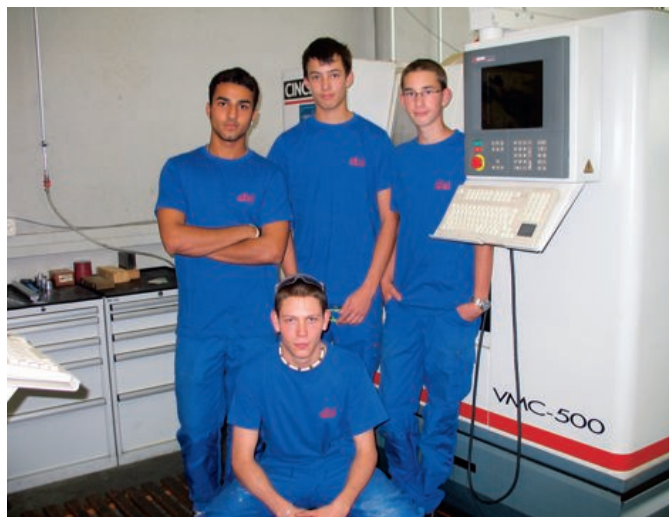
Apprentis du GIM-CH dans le Centre de formation appartenant au Groupement

rante en Suisse romande en tant que représentant de l'industrie de précision auprès de l'ensemble des services de la promotion économique des cantons romands, au travers du programme MicroTech Industry . Il faut se rappeler que ce sont les contacts privilégiés entre le GIM-CH et les organes officiels cantonaux, essentiellement le Canton de Vaud, qui ont permis au GIM-CH d'être à l'origine de MicroTech Industry , vaste programme intercantonal de valorisation de l'industrie microtechnique.