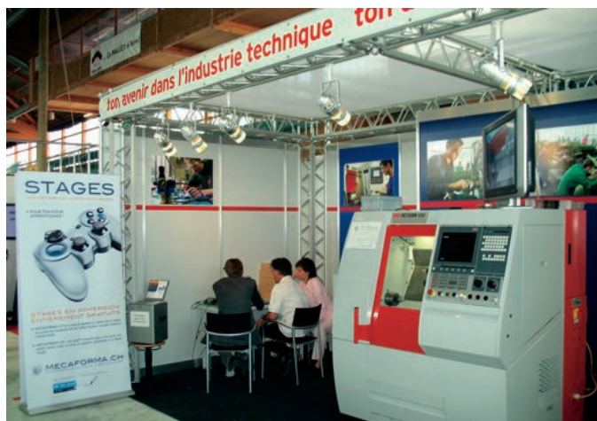
Stand du GIM-CH à «Planète Métier 2007»

une responsabilité dans le développement de ce projet.