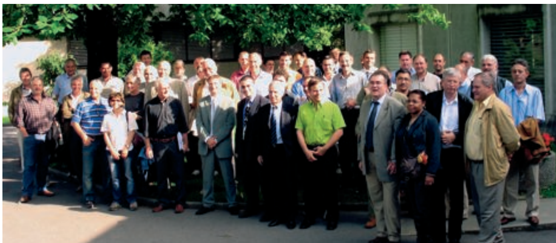
Les membres du GIM-CH lors de l'assemblée générale 2007 : une brise de convivialité!

A partir de cette période, on peut sans conteste dire que le GIM-CH est devenu la première association patronale romande de l'industrie suisse de précision, non pas forcément par sa taille, puisqu'elle regroupe quelque 180 membres, mais parce qu'elle mène une action globale sur la totalité de la Suisse romande, action qui inclut une relation privilégiée avec le syndicat, une exposition industrielle qui lui est propre sur le site de l' EPFL , une action normative en matière de sécurité au travail, une action de défense des intérêts patronaux en proposant notamment un plan de prévoyance professionnelle très attractif, un rôle de plus en plus important en matière de formation professionnelle et une place devenue prépondé-