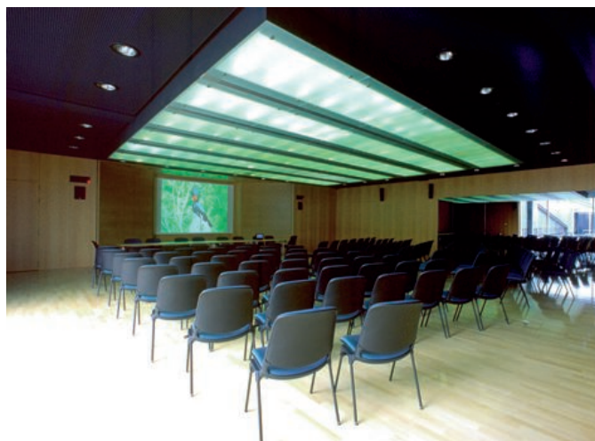
Centre patronal – Salle de séances